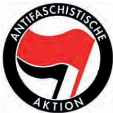
Abbildung 6: Antifaschistische Aktion, Wolfgang Sterneck 2012

So wie jede Subkultur oder Szene mit Symbolen arbeitet, um den Gruppenzusammenhalt nach innen zu stärken und sich gegenüber anderen abzugrenzen, nutzen auch AUTONOME bestimmte Zeichen, Gegenstände oder Wörter, die eine spezielle Bedeutung tragen. Viele dieser Symbole sind kurzlebig. Andere sind seit Jahrzehnten Erkennungszeichen, und wieder andere werden bewusst aus bis dahin bekannten Zusammenhängen gerissen und mit neuen Bedeutungen besetzt, um sie zum Beispiel nicht mehr Rechtsextremisten zu überlassen.