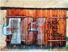
Abbildung 12: Zahlencodes

Symbolhaft für den Kampf um Freiräume steht das Zeichen für besetzte Häuser, das einen Kreis mit einem N-förmigen Blitz zeigt. Es soll auf die niederländische Hausbesetzerszene der 1970er-Jahre zurückgehen. „N“ steht dabei für „neemt“, niederländisch für „genommen“ oder „besetzt“.