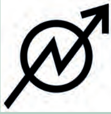
Abbildung 11: Symbol für besetzte Häuser

Symbolhaft für den Kampf um Freiräume steht das Zeichen für besetzte Häuser, das einen Kreis mit einem N-förmigen Blitz zeigt. Es soll auf die niederländische Hausbesetzerszene der 1970er-Jahre zurückgehen. „N“ steht dabei für „neemt“, niederländisch für „genommen“ oder „besetzt“.