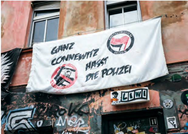
Abbildung 3: ©Max Arndt

Ein Achtungszeichen für die AUTONOME SZENE außerhalb der urbanen Zentren Leipzig und Dresden ist die seit 2016 jährliche Durchführung des antifaschistischen Jugendkongresses (JuKo) in Chemnitz.