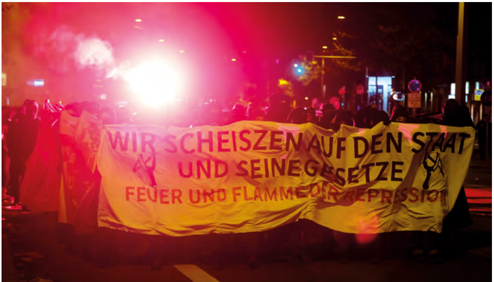
Abbildung 5:

Im Zusammenhang mit polizeilichen Durchsuchungsmaßnahmen in Leipzig und dem Bekanntwerden eines Strukturermittlungsverfahrens gem. § 129 StGB (Bildung krimineller Vereinigungen) gegen mehrere Beschuldigte durch den Generalbundesanwalt kam es zu mehreren Aktionen gegen die „staatliche Repression“. Das Strafverfahren gegen die Angeklagten wurde als Zeichen einer sich verstärkenden Repression des Staates („Verfolgungswelle“) gegen linke Strukturen wahrgenommen. Polizei und Justiz verfolgten demnach eine politische Agenda und würden mit ihren Ermittlungen das Narrativ einer „gefährlichen Linken“ bzw. eines „linken Terrorismus“ heraufbeschwören. Im Zusammenhang mit dem Prozess bildeten sich in der linksextremistischen Szene Solidaritätsstrukturen. Darüber hinaus fanden in diesem Kontext zahlreiche Demonstrationen, Solidaritätsaktionen und politisch motivierte Straftaten statt.