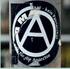
Abbildung 7: Anarchie

Das Anarcho-Zeichen ist das bekannteste Symbol des Anarchismus. Es wird auch von zahlreichen AUTONOMEN verwendet. Das große „A“ in einem Kreis soll Pierre Joseph Proudhons Maxime „Anarchie ist Ordnung“ verdeutlichen. Proudhon (1809-1865) war ein französischer Anarchist, der eine Neuordnung der Gesellschaft ohne jegliche Staatsgewalt anstrebte. Die gesellschaftlichen Beziehungen sollten lediglich nach dem Prinzip der freiwilligen Gegenseitigkeit geregelt werden. Die Anarcho-Punk-Bewegung nutzte ab den 1980er-Jahren dieses Symbol und verhalf ihm zu allgemeinem Bekanntheitsgrad. Der Kreis symbolisiert dabei auch Einigkeit. Insofern steht dieses Emblem für die identitätsstiftende Verbundenheit aller anarchistischen Gruppen, auch wenn diese unterschiedliche Positionen vertreten. Das Anarcho-Zeichen ist nicht verboten.