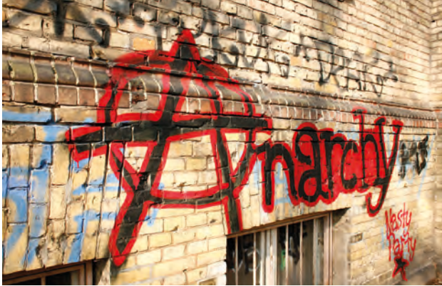
Abbildung 1: ©Picture Alliance

sellschaft im Sinne einer Gesellschaftsordnung ohne Staat, Militär und Justiz. Die Frage nach der Strategie und Taktik zur Umsetzung dieses Zieles wird im Anarchismus zwar unterschiedlich beantwortet. Aber: Allen anarchistischen Konzepten, ob militant oder gewaltfrei, ist Antiparlamentarismus gemeinsam. Die Eroberung der parlamentarischen Mehrheit ist für ANARCHISTEN sinnlos, denn es geht ihnen nicht um die Erlangung der Macht, sondern um die Beseitigung des Staates.