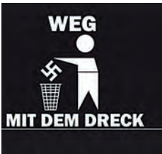
Abbildung 8: In den Mülleimer entsorgtes Hakenkreuz

Das Anarcho-Zeichen ist das bekannteste Symbol des Anarchismus. Es wird auch von zahlreichen AUTONOMEN verwendet. Das große „A“ in einem Kreis soll Pierre Joseph Proudhons Maxime „Anarchie ist Ordnung“ verdeutlichen. Proudhon (1809-1865) war ein französischer Anarchist, der eine Neuordnung der Gesellschaft ohne jegliche Staatsgewalt anstrebte. Die gesellschaftlichen Beziehungen sollten lediglich nach dem Prinzip der freiwilligen Gegenseitigkeit geregelt werden. Die Anarcho-Punk-Bewegung nutzte ab den 1980er-Jahren dieses Symbol und verhalf ihm zu allgemeinem Bekanntheitsgrad. Der Kreis symbolisiert dabei auch Einigkeit. Insofern steht dieses Emblem für die identitätsstiftende Verbundenheit aller anarchistischen Gruppen, auch wenn diese unterschiedliche Positionen vertreten. Das Anarcho-Zeichen ist nicht verboten.