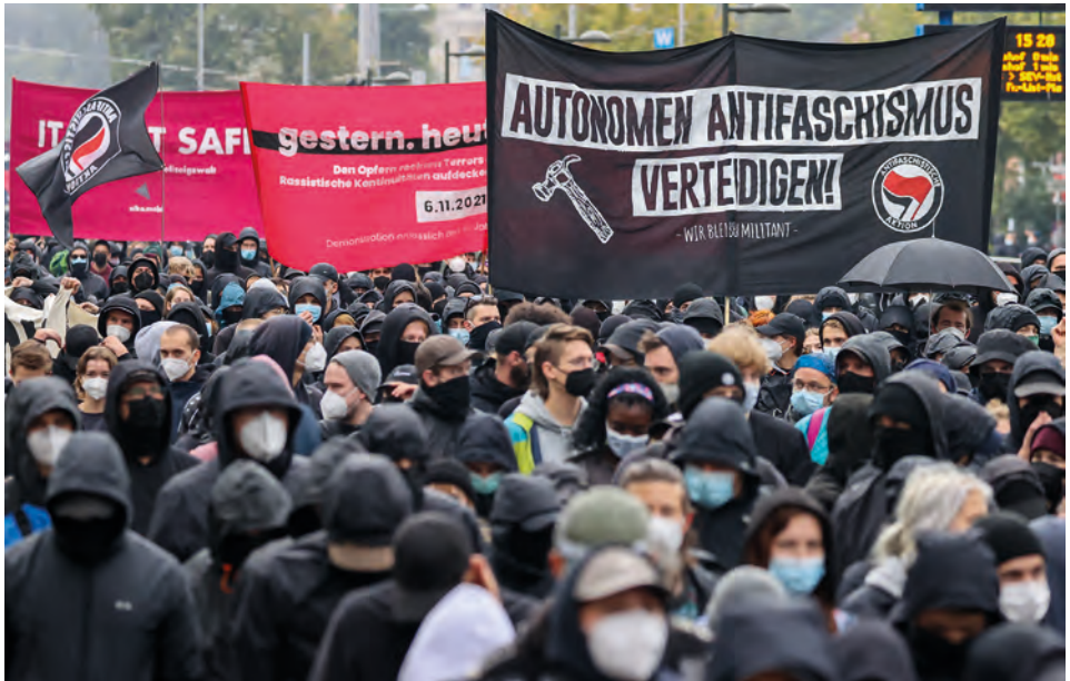
Abbildung 13:

bietet. Der „Schwarze Block“ entsteht so aus Menschen, die „Hassmasken“, Sonnenbrillen, schwarze Regenjacken oder Kapuzenpullover, Hosen und Turnschuhe tragen. In den letzten Jahren waren verstärkt auch schwarze oder bemalte Regenschirme zu sehen.