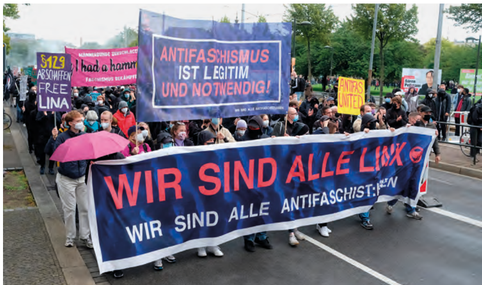
Abbildung 4:

Aus Sicht der linksextremistischen Szene hat in den vergangenen Jahren ein „Rechtsruck“ in der Gesellschaft stattgefunden, der rechtsextremistische und rassistische Positionen in einem „ungeahnten Ausmaß“ gesellschaftsfähig gemacht habe. Demnach fänden sich derartige Einstellungen nicht mehr allein bei den NEONATIONALSOZIALISTEN, sondern vor allem auch bei der Neuen Rechten.