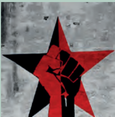
Abbildung 9: Fünfsackiger schwarz-roter Stern

Die Verwendung durchgestrichener oder in den Mülleimer entsorgter Hakenkreuze durch die Autonome Antifa führte bereits zu juristischen Auseinandersetzungen. Der Bundesgerichtshof entschied im Jahr 2007, dass die Verwendung verfremdeter nationalsozialistischer Symbole bei „offenkundiger und eindeutiger“ Distanzierung zulässig ist.